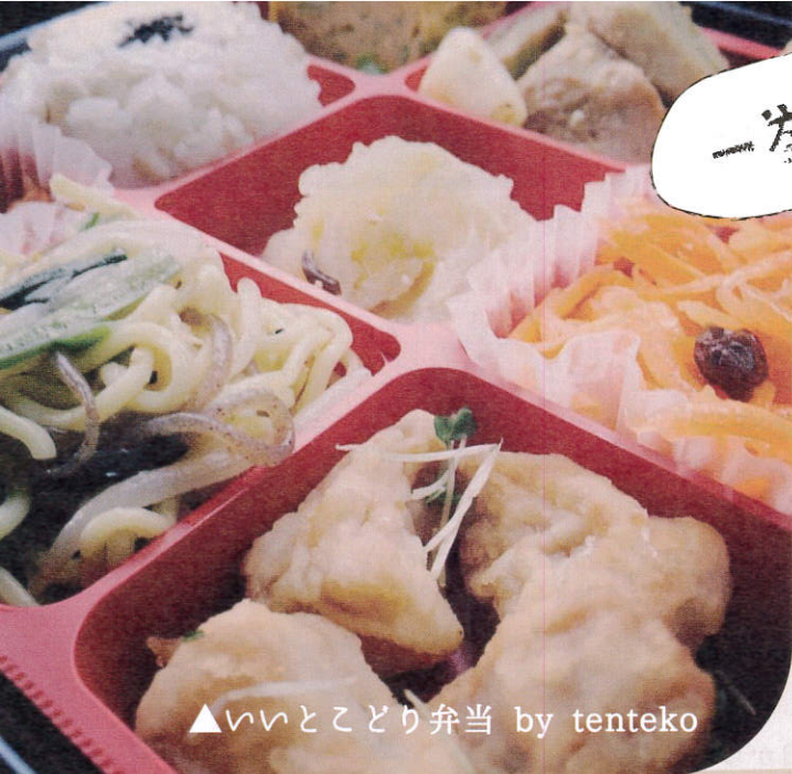
▲いいとこどり弁当 by tenteko

道の駅の加工品コーナーを改めてご紹介。手作りのお弁当、惣菜は店頭に20種類以上、お昼や行楽にいかがでしょうか。 本チラシ右上にテイクアウトコーヒー50円割引も併せてご利用ください。